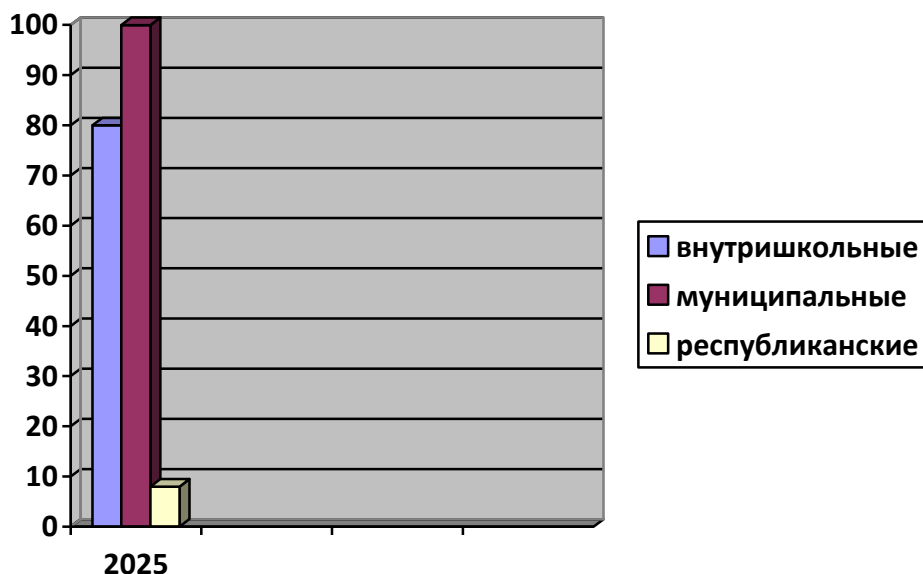
Диаграмма 1 . Количество призеров в 2025 году

Призерами внутришкольных мероприятий в 2025 году стали – 80 обучающихся, муниципальных и межмуниципальных – 100, республиканских - 8